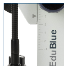
Échelle de mise au point rapide