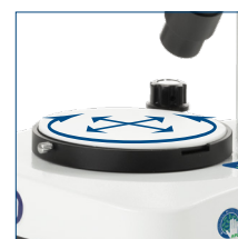
Platine porte objet mobile